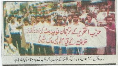
حزب اتحریر کے ترجمان نوید بٹ کی بڑی تعداد کو انخواہ کے خلاف کے قیام کو روکنے کے لیے احتجاجی مظاہرہ کیا گیا۔

نوید بٹ کے انخواہ کے خلاف حزب اتحریر کا احتجاجی مظاہرہ کراچی (پ ر) حزب اتحریر کے ترجمان نوید بٹ کے انخواہ کے خلاف حزب اتحریر نے کراچی پریس کلب پر احتجاجی مظاہرہ کیا۔ مظاہرین نے ہتھیار ڈال دیے اور انہیں ہتھیار چھوڑنے پر آمادگی دکھائی۔ حزب اتحریر کے ترجمان نوید بٹ کی بڑی تعداد کو انخواہ کے خلاف کے قیام کو روکنے کے لیے احتجاجی مظاہرہ کیا گیا۔ مظاہرین نے نوید بٹ کی بڑی تعداد کو انخواہ کے خلاف کے قیام کو روکنے کے لیے احتجاجی مظاہرہ کیا۔ مظاہرین نے نوید بٹ کی بڑی تعداد کو انخواہ کے خلاف کے قیام کو روکنے کے لیے احتجاجی مظاہرہ کیا۔