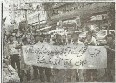
حزب اتحریر کے کارکنان ترجمان نوید بٹ کی گرفتاری کے خلاف پریس کلب باہر احتجاج کر رہے ہیں۔