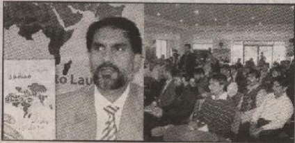
حزب تحریک پاکستان کے ترجمان نواہد بٹ کی جماعت کے منشور کا اعلان کرنے ہیں