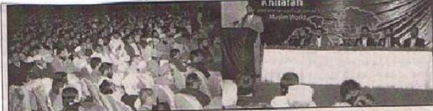
اسلام آباد: حزب التحریر کے ترجمان "ایک امت۔ ایک ریاست۔ تکی مائی طاقت" کے عنوان سے منعقد کی گئی کانفرنس سے خطاب کر رہے ہیں۔

اسلام آباد (پ) حزب التحریر کا خطاب کے قیام کی اچھی سیٹی ترکیب کے متوالی ہوئی ہے۔ اس سلسلے میں حزب نے "ایک ریاست۔ تکی مائی طاقت" کے ذمہ داران اسلام آباد میں کانفرنس منعقد کی۔ کانفرنس منعقد کی۔ کانفرنس سے خطاب کے بعد حزب کے ممبران بین الاقوامی سطح پر جاری کیے۔ انجمن "عوامی تعلیمات" کے مقررین کا خطاب کے قیام کی اچھی سیٹی ترکیب کے متوالی ہوئی ہے۔ اس سلسلے میں حزب نے "ایک ریاست۔ تکی مائی طاقت" کے ذمہ داران اسلام آباد میں کانفرنس منعقد کی۔ کانفرنس منعقد کی۔ کانفرنس سے خطاب کے بعد حزب کے ممبران بین الاقوامی سطح پر جاری کیے۔ انجمن "عوامی تعلیمات" کے مقررین کا خطاب کے قیام کی اچھی سیٹی ترکیب کے متوالی ہوئی ہے۔ اس سلسلے میں حزب نے "ایک ریاست۔ تکی مائی طاقت" کے ذمہ داران اسلام آباد میں کانفرنس منعقد کی۔ کانفرنس منعقد کی۔ کانفرنس سے خطاب کے بعد حزب کے ممبران بین الاقوامی سطح پر جاری کیے۔