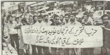
حزب التحریر کے کارکنان نوبید بٹ کی گرفتاری کے خلاف کراچی پریس کلب کے باہر مظاہرہ کر رہے ہیں