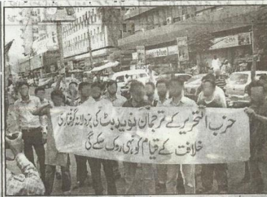
حزب التحریر کے کارکنان ترجمان نوبید بٹ کی گرفتاری کے خلاف پریس کلب پر احتجاج کر رہے ہیں

اتوار 21 جنوری الٹا یہ 1433ء مطابق 13 مئی 2012ء