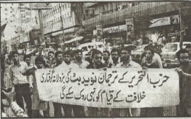
پریس کلب کے باہر حزب التحریر کے کارکنان احتجاجی مظاہرہ کر رہے ہیں