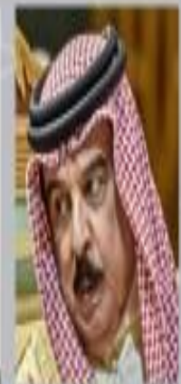
King of Bahrain Hamad bin Isa Al Khalifa