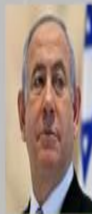
Israel's Prime Minister Benjamin Netanyahu

Palestinian President Mahmoud Abbas slammed the agreement as a "betrayal" of the Palestinian cause - with the Gulf countries renegeing on a promise made by Arab states not to embrace ties with Israel until Palestinian statehood is achieved