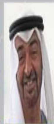
Abu Dhabi Crown Prince Mohammed bin Zayed