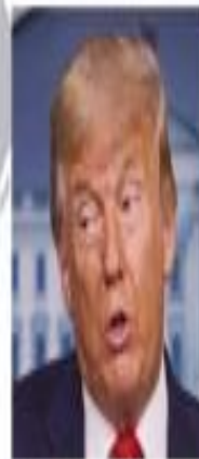
US President Donald Trump

The US-brokered deal is a huge victory for US President Donald Trump as he seeks a second term on 3 November