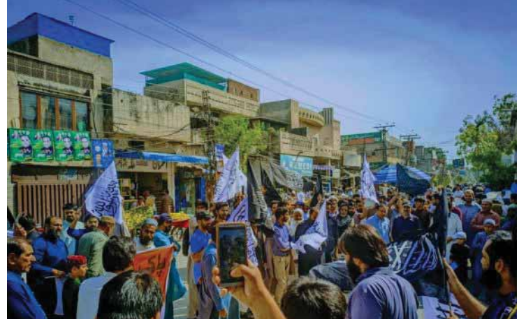
Lahor'daki Gösteriden Kesitler