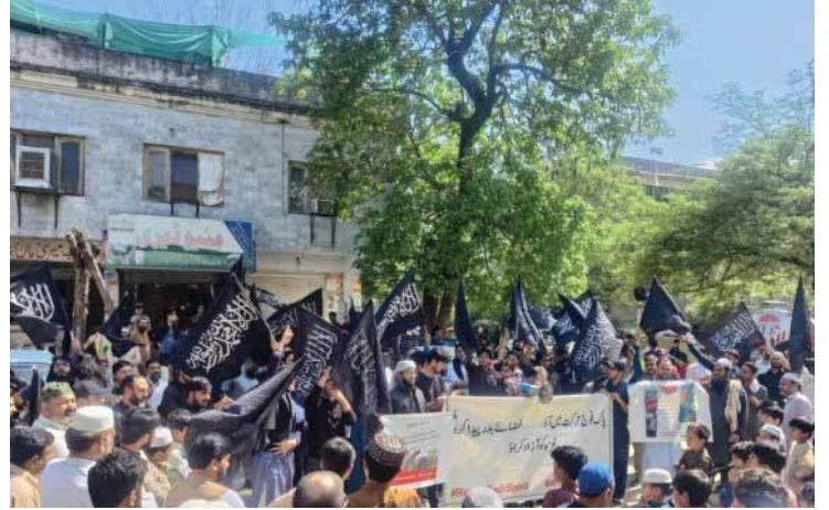
İslamabad'daki Gösteriden Kesitler