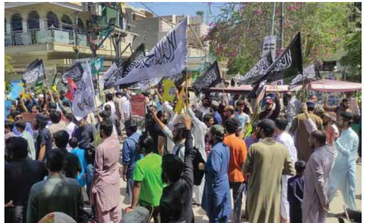
Karacı'deki Gösteriden Kesitler