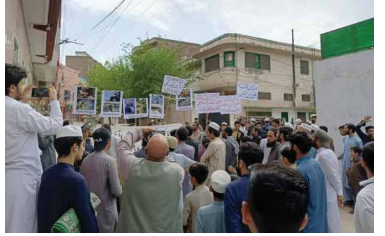
Peşavar'daki Gösteriden Kesitler